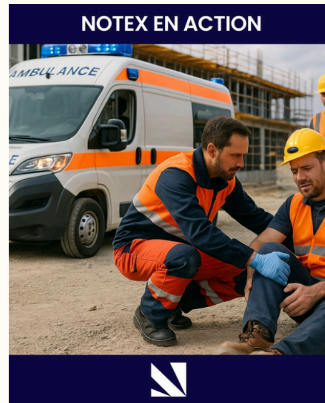
• NOTEX EN ACTION