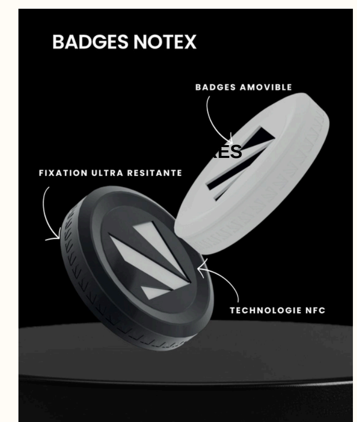
• ZOOM PRODUIT