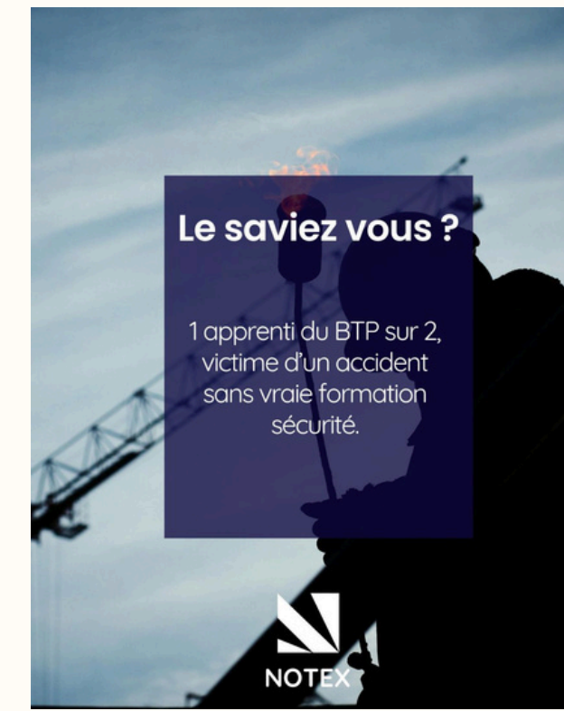
• LE SAVIEZ VOUS