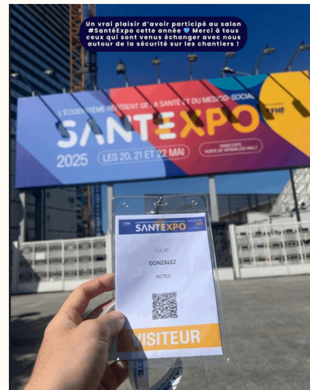
• NOS ACTUS ET EVENNEMENTS