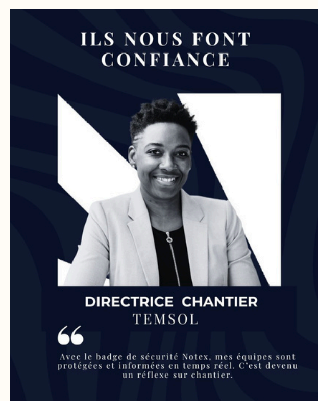
• ILS EN PARLENT